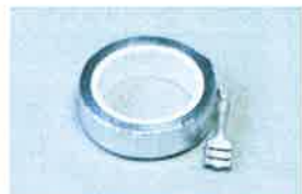
アルミ粘着リボンアンテナ