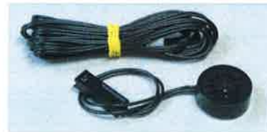
ブザー&ブザーハーネス