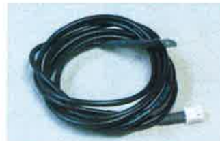
センサーハーネス