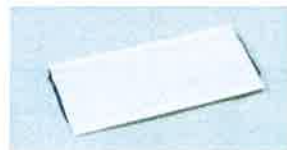
本体固定用粘着材