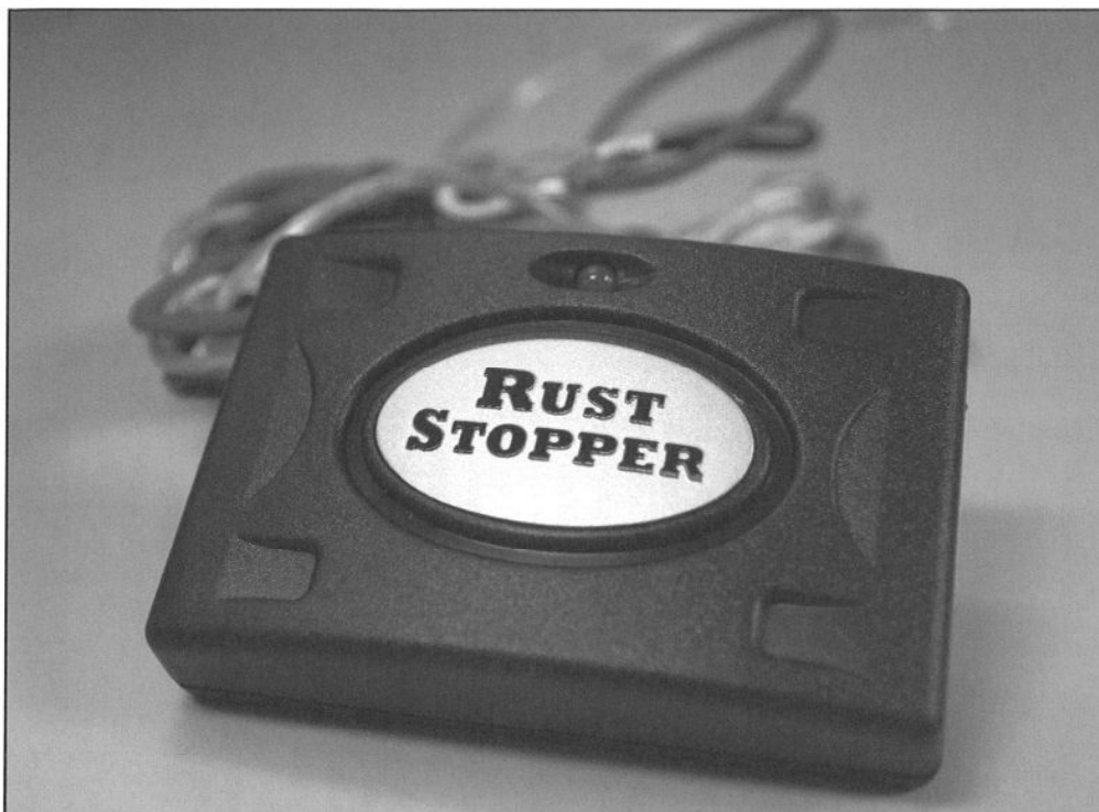
【電子錆び防止装置 RUST STOPPER】