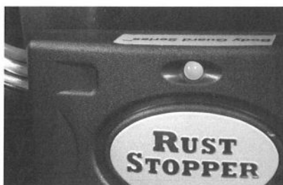
本体上部のインジケーターが、作動中であることを知らせてくれる。消費電流は3mA程度と非常に少ないが、万一バッテリーの電圧が12.1Vいかに低下すると自動的にストップする。

問い合わせ ツーフィット株式会社 神奈川県横浜市中区長者町5-75-1 tel.045-253-7945 http://www.to-fit.co.jp