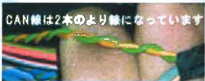
※色は写真とは異なります