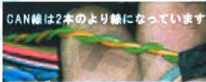
CAN線は2本のより線になっています